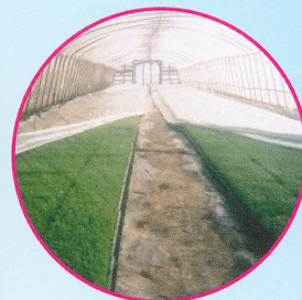
※育苗器から出した後の緑化にも